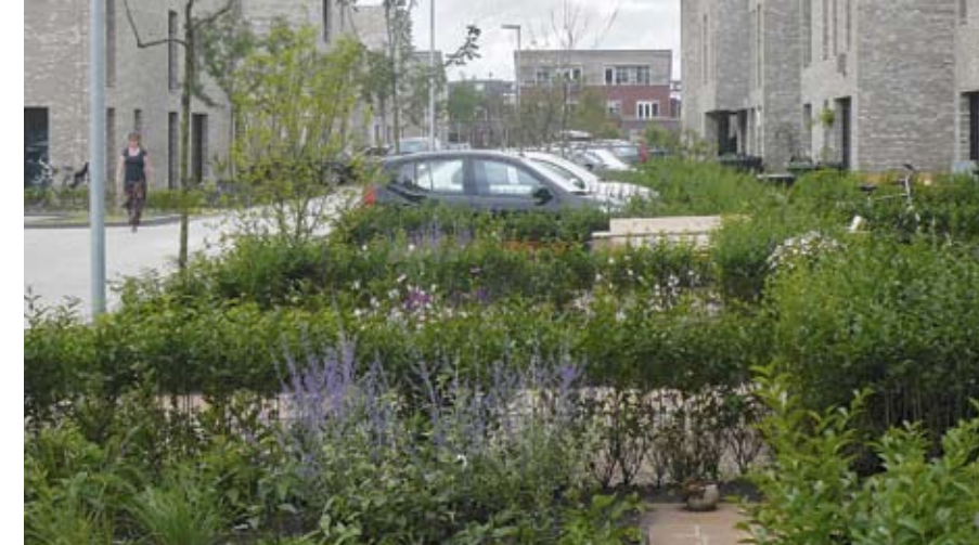
De auto's worden in de voortuin geparkeerd, maar domineren het straatbeeld niet.

De tuinpaden zijn verhard met betontegels van het Belgische Ebema, de kleur heeft Tavenier afgestemd op de aardetin-