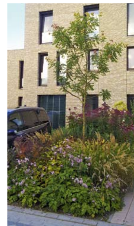
Elke voortuin kreeg een border met diverse soorten vaste planten en heesters. De border wordt in de hele straat herhaald. Hier onder meer Anemone tomentosa 'Robustissima', Cotinus coggygria 'Royal Purple', Calamagrostis brachytricha , Eupatorium maculatum 'Atropurpureum' en Echinacea purpurea 'Rubinglow'.

Volgens Tavenier heeft de collectieve aanpak van straten en wijken de toekomst. Hij ziet niet alleen mogelijkheden bij nieuwbouw, maar ook bij renovaties. „Je kunt het zien als revival van de tuinwijk, waarin het groen heel bepalend is voor de woonomgeving. Ik denk dat mensen moeten loskomen van de neiging om de eigen buitenruimte helemaal af te palen.” ■